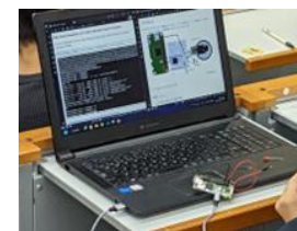
教材環境 Raspberry Pi Zero 版 CHIRIMEN

参加者： 大学生8名、専門学校生2名、高専生12名、高校生10名、小学生2名 計34名(7チームがハッカソン参加)