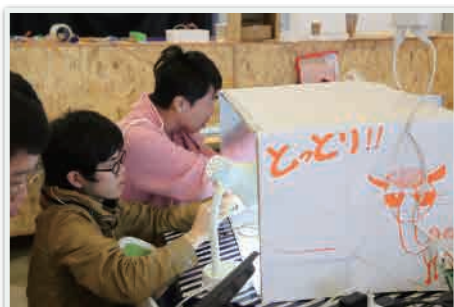
昨年開催された「Web×IoT メイカーズチャレンジ 2017」の様子